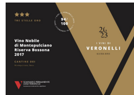
Guida Veronelli 3 Stelle Oro