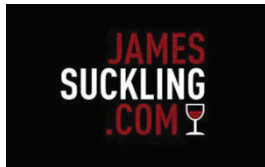
James Suckling 95 / 100